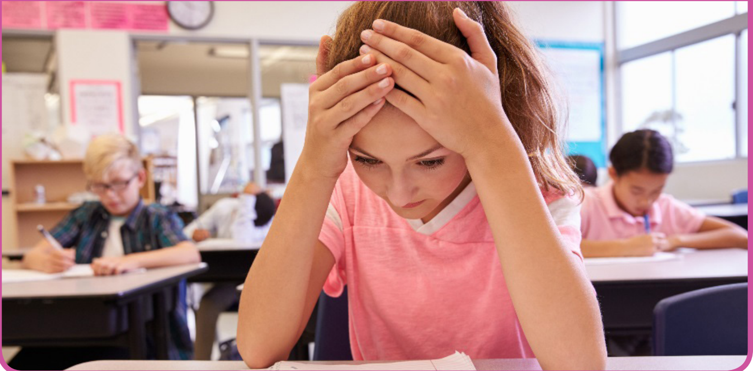
©2017 The University of Texas Health Science Center at Houston. All rights reserved.